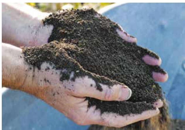
Le compost mûr se caractérise par sa couleur foncée et sa structure grumeleuse.

Il favorise la croissance des plantes et leur développement racinaire.